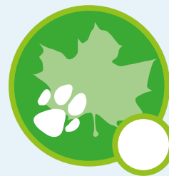
Mein tierisch grüner Daumen